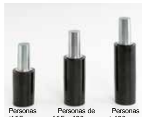
Personas <165 cms. Personas de 165 a 183 cms. Personas >183 cms. Op. 3 alturas diferentes. 3 heights option. Option 3 hauteurs.