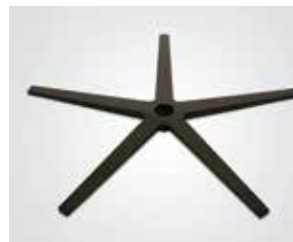
Base aspa acero negro. Blade black steel base. Lame base acier noir.