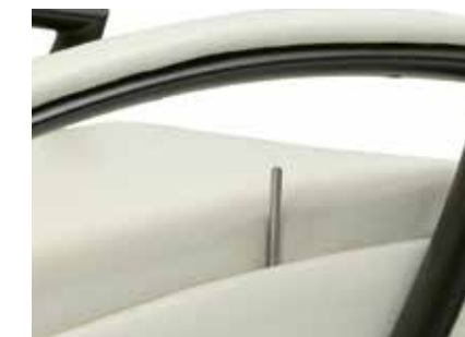
Detalle pistón de gas Gas piston drive detail Détail de piston à gaz