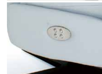
Detalle botonera eléctrica (doble motor) Detail electric button panel (double motor) Détail panneau des boutons électrique