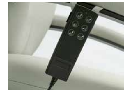
Detalle mando eléctrico (doble motor) Electric control detail Détail de contrôle électrique