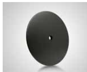
Base plato acero negro. Black steel foot plate. plaque de pied acier noir.