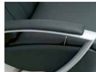
Opción brazo metal gris. Gray metal arm option. Option bras métal gris.