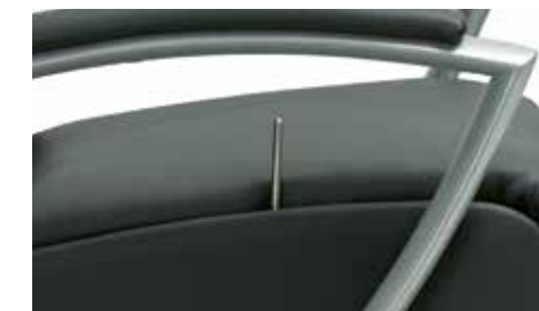
Detalle activador pistón de gas Inner seat height Hauteur intérieure du siège

Brazos de metal en Negro o Gris Bras en métal en noir ou gris / Metal arms in Black or Gray