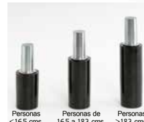
Op.3 alturas diferentes. 3 heights option. Option 3 hauteurs.