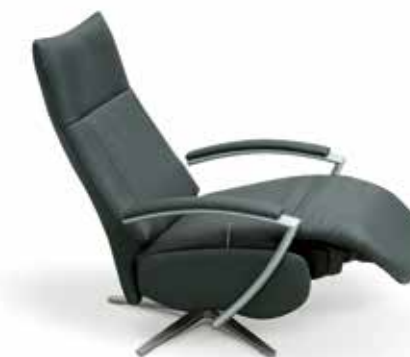
Cabecero adaptable. Headboard adaptable. Tête adaptable.