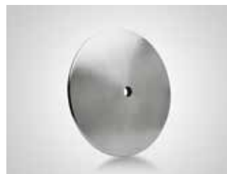
Base plato acero mate. Steel foot plate. Plaque de pied acier.