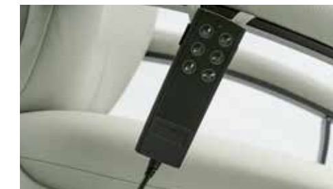
Detalle mando eléctrico (doble motor) Electric control detail Détail de contrôle électrique