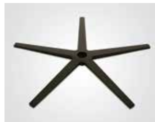
Base aspa acero negro. Blade black steel base. Lame base acier noir.