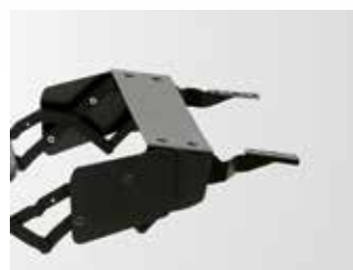
Op. protección bisagras. Hinges protection option. Option protection de chamiers.