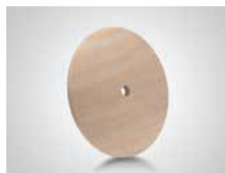
Base plato madera. Wool foot plate. Plaque de pied bois.