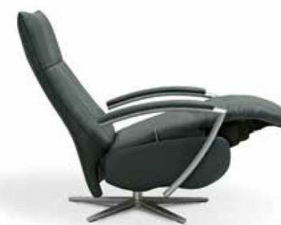
Asiento continuo gran avance. Continuous seat great advance. Siège continu grande avance.

Altura asiento interior 47 Inner seat height / Hauteur intérieure du siège Ancho interior 54 Interior width / Profondeur intérieure