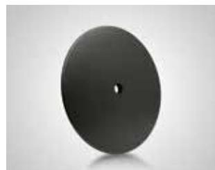
Base plato acero negro. Black steel foot plate. plaque de pied acier noir.