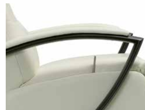
Opción brazo metal negro. Black metal arm option. Option bras métal noir.