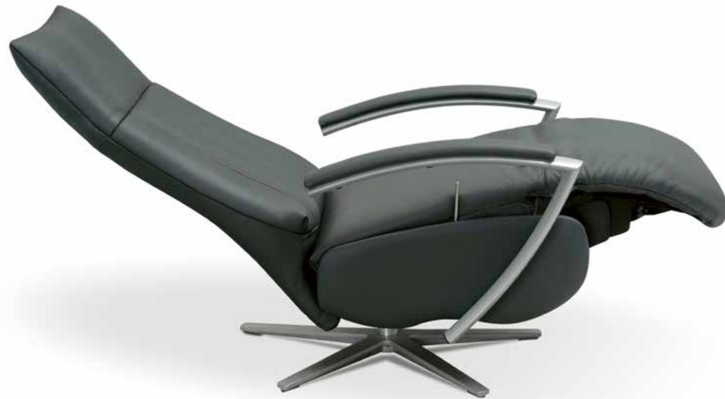
Respaldo accionado mediante pistón de gas o motor eléctrico. Backrest powered by gas piston or electric motor. Dossier alimenté par un piston à gaz ou moteur électrique.