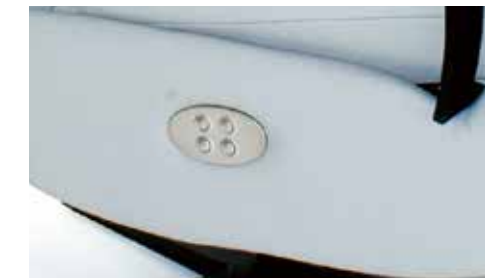
Detalle botonera eléctrica (doble motor) Detail electric button panel (double motor) Détail panneau des boutons électrique.