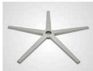
Base aspa acero mate. Blade steel base. Lame base acier.