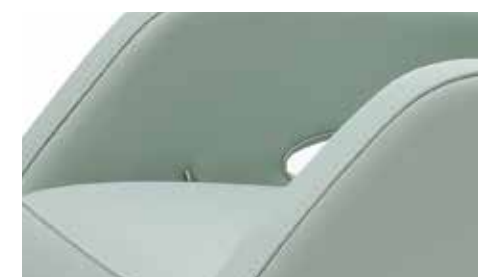
Detalle activador pistón de gas Inner seat height Hauteur intérieure du siège