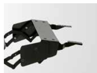
Op. protección bisagras. Hinges protection option. Option protection de chamiers.