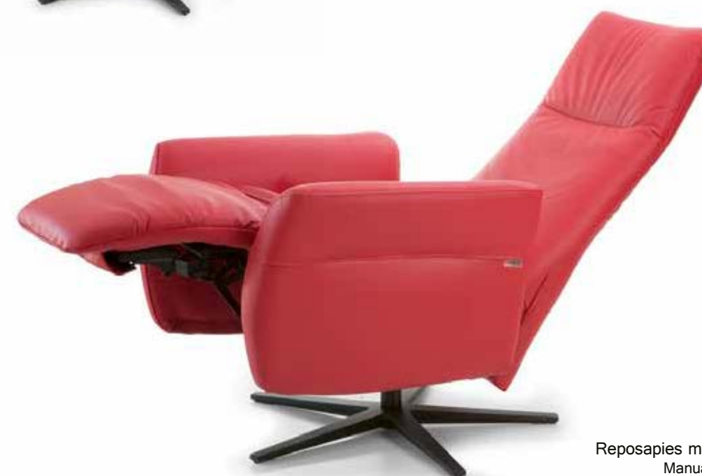
Reposapiés manual fácil apertura o motor eléctrico. Manual footrest easy opening or electric motor. Repose-pieds manual ouverture facile ou moteur électrique.