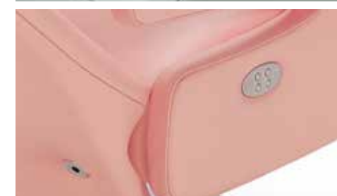
Detalle botonera eléctrica (doble motor) Detail electric button panel (double motor) Détail panneau des boutons électrique.