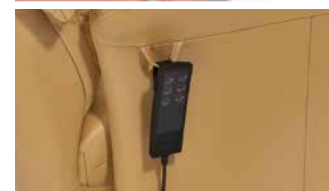
Detalle mando eléctrico (doble motor) Electric control detail Détail de contrôle électrique