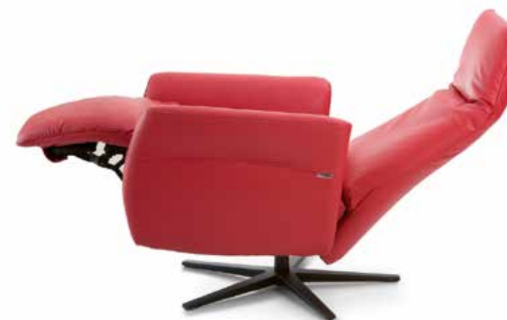
Cabecero articulado. Headboard adaptable. Tête adaptable.