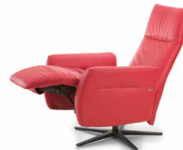
Asiento continuo gran avance. Continuous seat great advance. Siège continu grande avance.