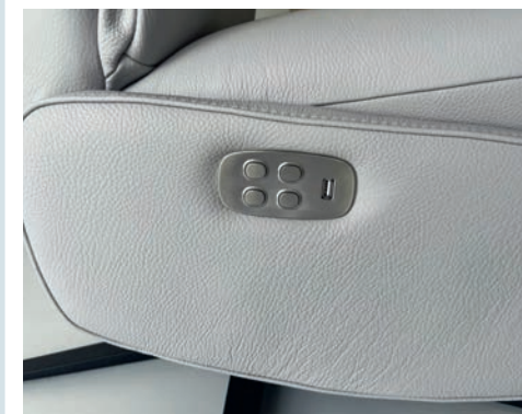
Detalle botonera eléctrica, (doble motor) Detail electric button panel, (double motor) Détail panneau des boutons électrique