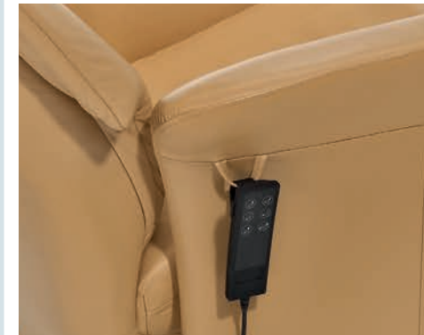
Detalle mando eléctrico, (doble motor) Electric control detail Détail de contrôle électrique