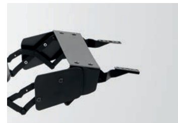
Op. protección bisagras Hinges protection option Option protection de charniers