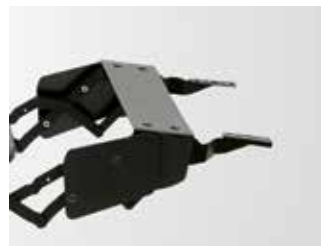
Op. protección bisagras. Hinges protection option. Option protection de charniers.