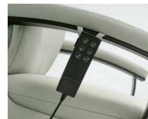
Detalle mando eléctrico (doble motor) Electric control detail Détail de contrôle électrique