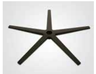
Base aspa acero negro. Blade black steel base. Lame base acier noir.