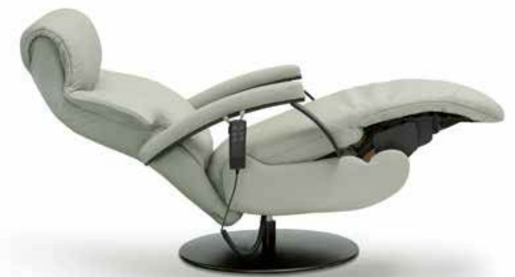
Cabecero adaptable. Headboard adaptable. Tête adaptable.