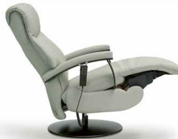
Asiento continuo gran avance. Continuous seat great advance. Siège continu grande avance.