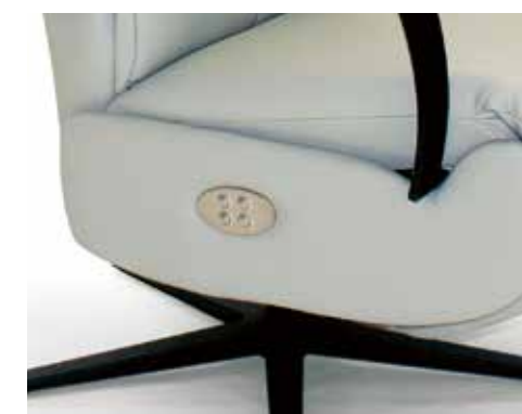
Detalle botonera eléctrica (doble motor) Detail electric button panel (double motor) Détail panneau des boutons électrique.